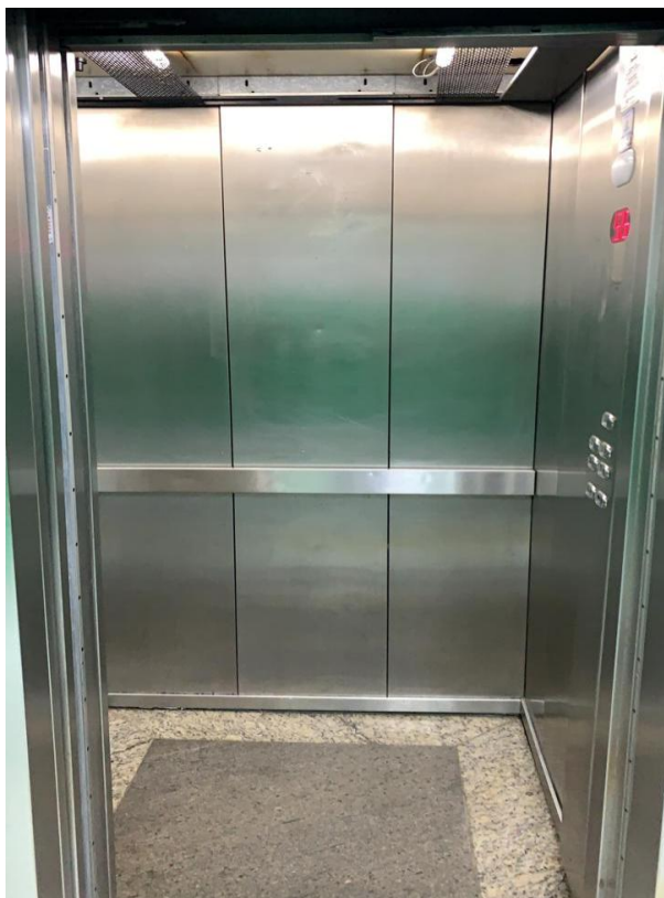
Fig. 2- Faltam: corrimãos em todos os lados da cabine em cor contrastante e espelho painel do fundo.

COORDENADORIA DE LICITAÇÕES, CONTRATOS E COMPRAS