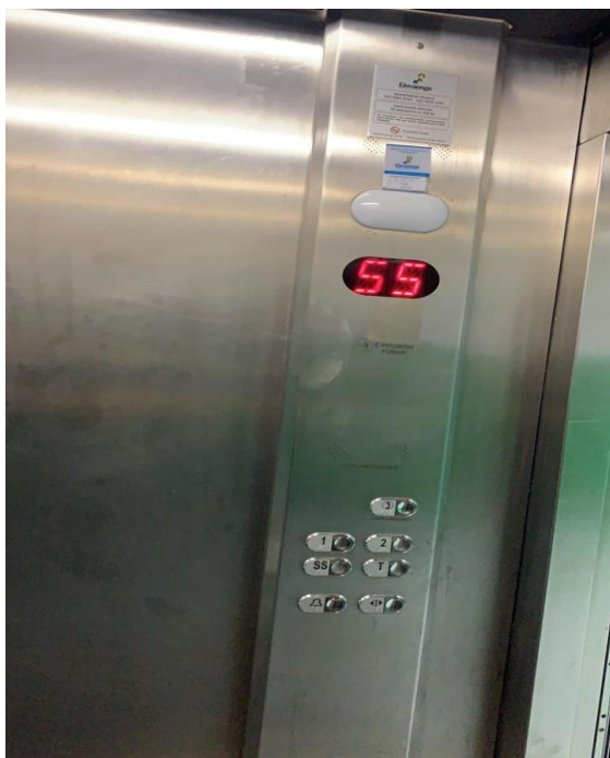
Fig. 3- Faltam: Sinalização em braile, sinalização sonora e sistema de sinalização direcional digital.