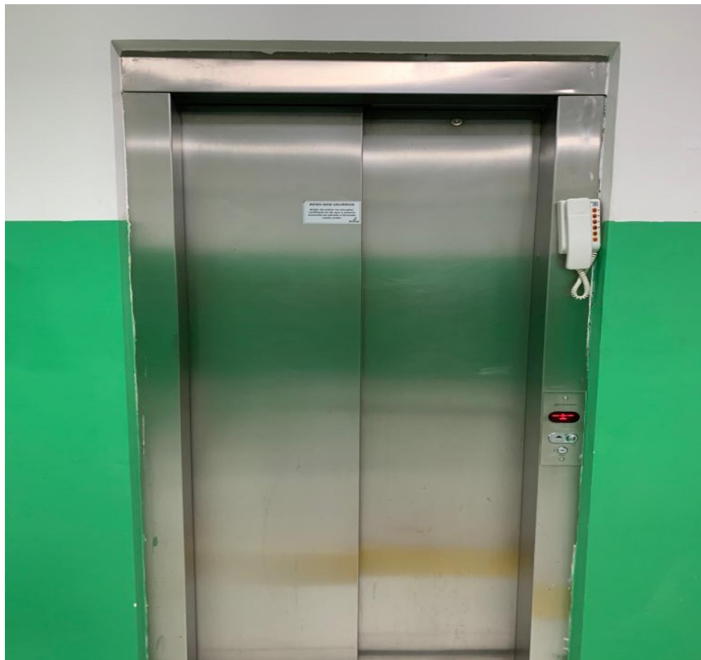
Fig. 1- O sistema de comunicação não funciona, Previsão de instalação de botões de micro contato iluminados, sinalização em braile painel externo.

Observação: as imagens inseridas nesse Projeto Básico, visam fundamentar materialmente a necessidade da adequação, e ainda como Memorial Descritivo para aprovação das adequações do elevador de passageiros junto aos órgãos fiscalizadores.